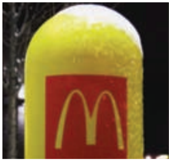
Personnalisez vos gaines avec votre logo