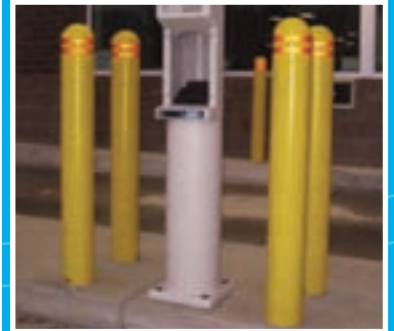
Possibilité d'ajouter des bandes réfléchissantes