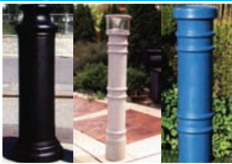
Gaines de finition, joindre durabilité, esthétique et utilité