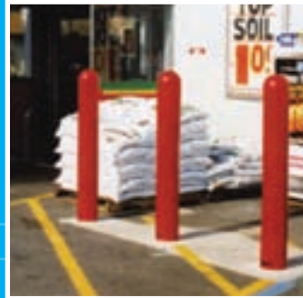
Résiste aux intempéries, traitées anti-UV et antistatique