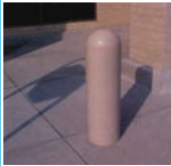
Se coupe facilement pour s'ajuster à la hauteur désirée