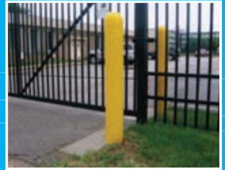
Différents diamètres offerts (de 3 à 10 pouces) Hauteur standard de 52 pouces