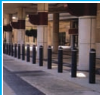
Variété de couleurs offertes