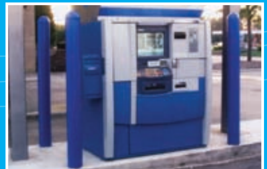
Sécurité et propreté